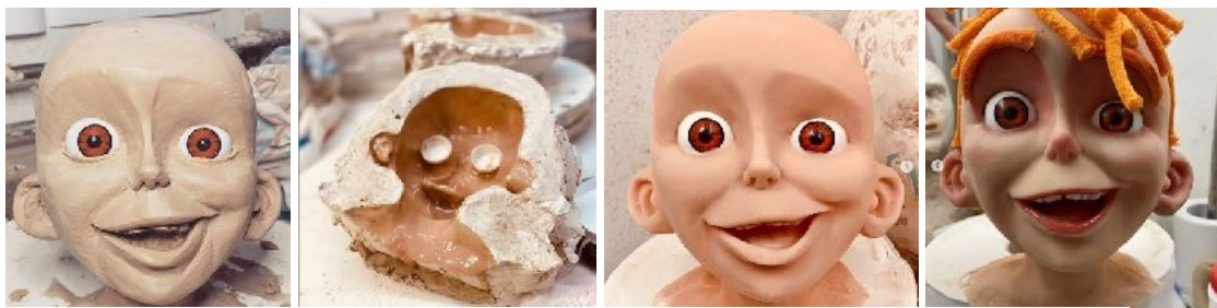
Foto: Maakproces van de pop 'Stompje' voor de voorstelling Lange Tanden .